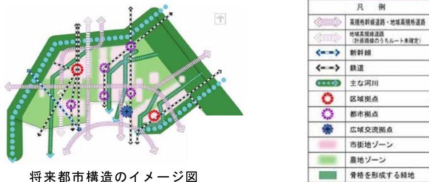
将来都市構造のイメージ図

豊かな水と緑の中で、広域交通ネットワークをいかして産業が力強く発展する都市づくり