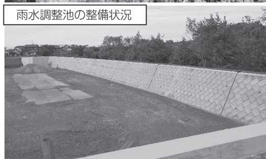
建設地の状況 (令和6年10月末時点)