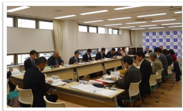
江南市まちづくり会議の様子