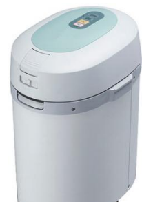
家庭用生ごみ処理機