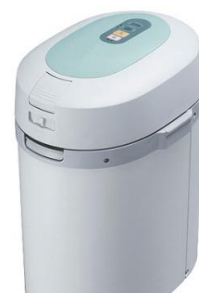
家庭用生ごみ処理機