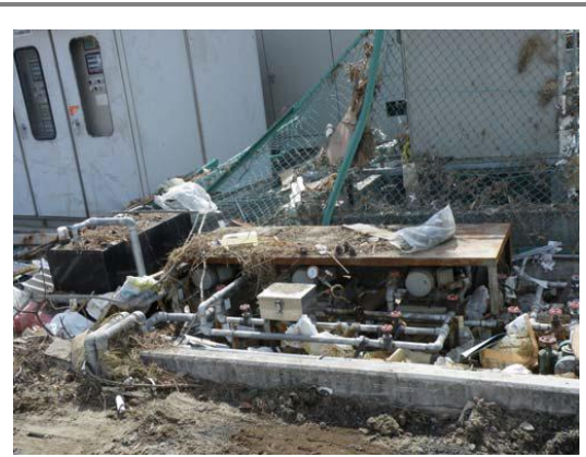
ポンプ設備の津波による被災状況