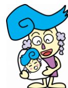
江南市マスコットキャラクター ふじか 『藤花ちゃん』

子育て支援課 (こども家庭センター) 電話 0587-58-5850 (直通) 受付時間 平日 8:30~17:15 (土日祝日を除く)