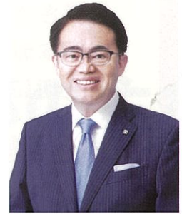
日本赤十字社愛知県支部 支部長