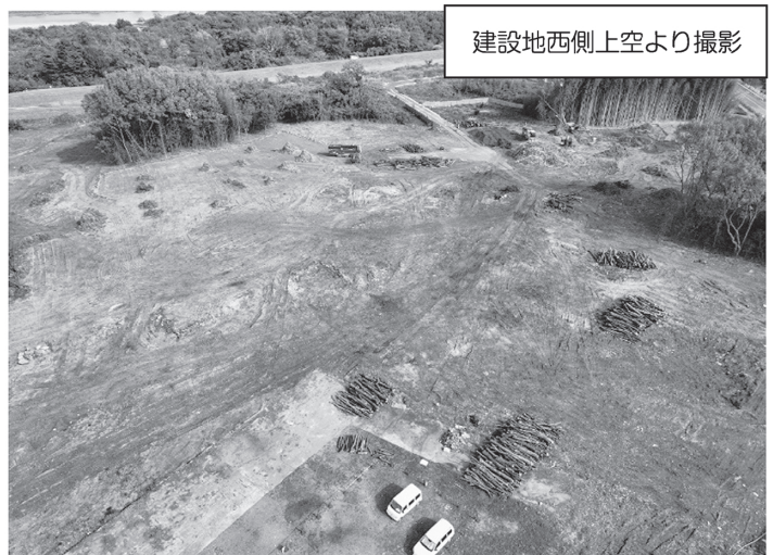
建設地の状況(令和5年11月末時点)