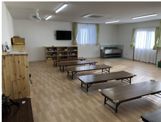
布袋北学童保育所