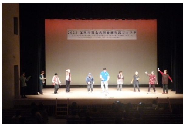
江南市男女共同参画市民フェスタ