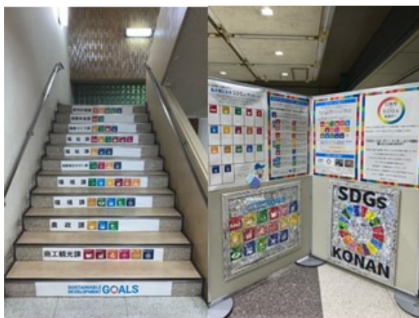
SDGs週間（KONAN SDGs Week）