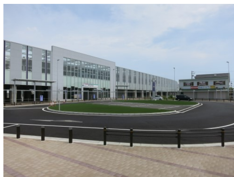
布袋駅西駅前広場