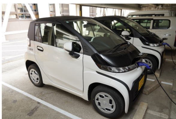
超小型電気自動車

これらの取り組みにより、従来のインフラ整備に加え、デジタル技術などの次世代技術を効果的に取り入れるとともに、ゼロカーボンシティの実現に向けた環境に配慮した新たなまちづくりを進め、快適で住みよさを実感できるまちを実現します。