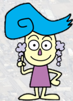
江南市マスコットキャラクター ふじか 「藤花ちゃん」

この愛称は、江南市を愛し、総合計画を意志堅固に進め、愛知県の江南市ということアピールするとともに、市民と行政が連携して知恵を出し合い、親しみやすく暮らしやすい市をめざしてほしいとの願いが込められています。