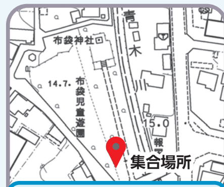
布袋神社…布袋児童遊園トイレ付近