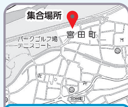
蘇南公園…パークゴルフ場東側あずまや付近