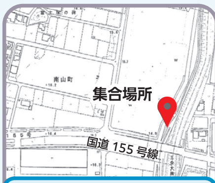
五条大橋…国道155号線北側の尾北自然歩道の休憩所付近