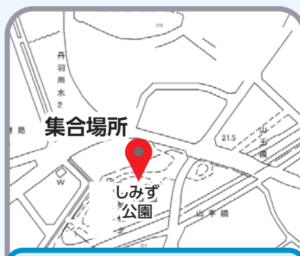
しみず公園…公園トイレ付近