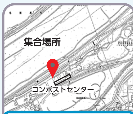
フラワーパーク江南…公園西側コンポストセンター前