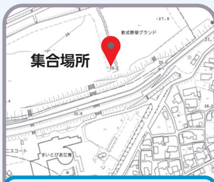
江南緑地公園(草井) …すいとぴあ江南北側の芝生広場と野球場の間の駐車場